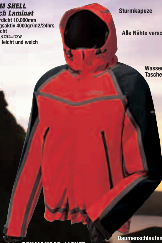
DENALI HOOD JACKET