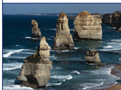
Australien, Great Ocean Road

20.12.08 - 5.1.09 Flug, Bus, ***, ****Hotels/NF, Bootsfahrt, Weinkost, Eintritte, RL: Dr. U. Stutz € 4.420,-