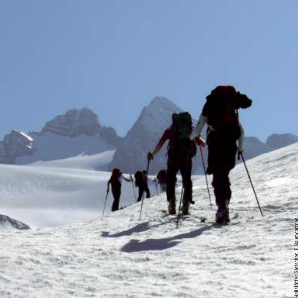
Hallstätter Gletscher, T. Baumgartner