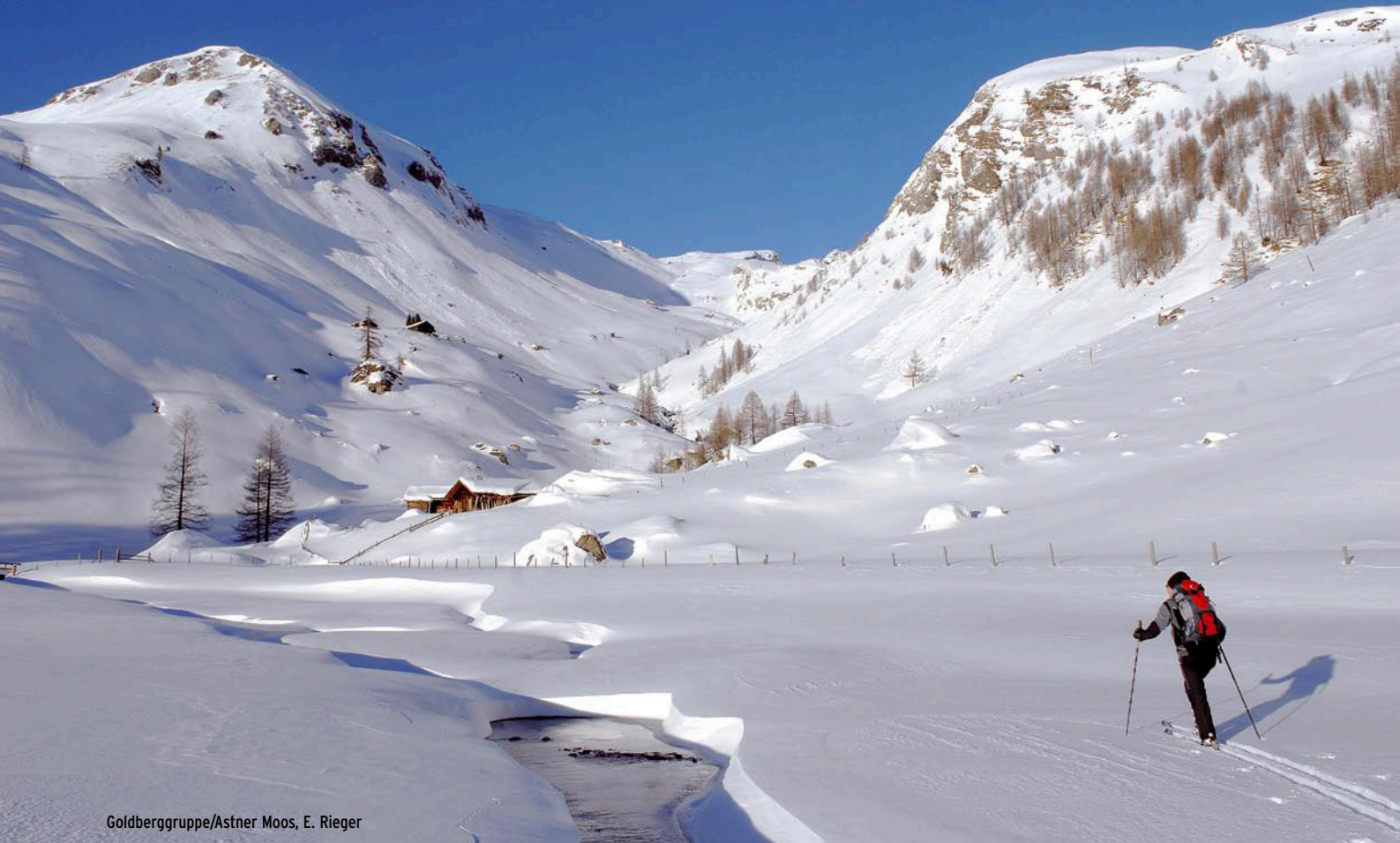
Goldberggruppe/Astner Moos, E. Rieger