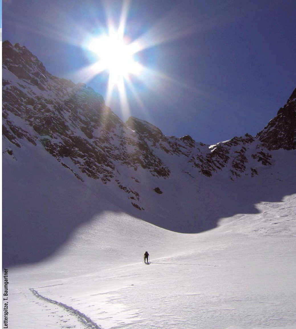
Letterspitze, T. Baumgartner

K3 7 - 10 Stunden / Tag (Auf- Abstieg/Abfahrt)