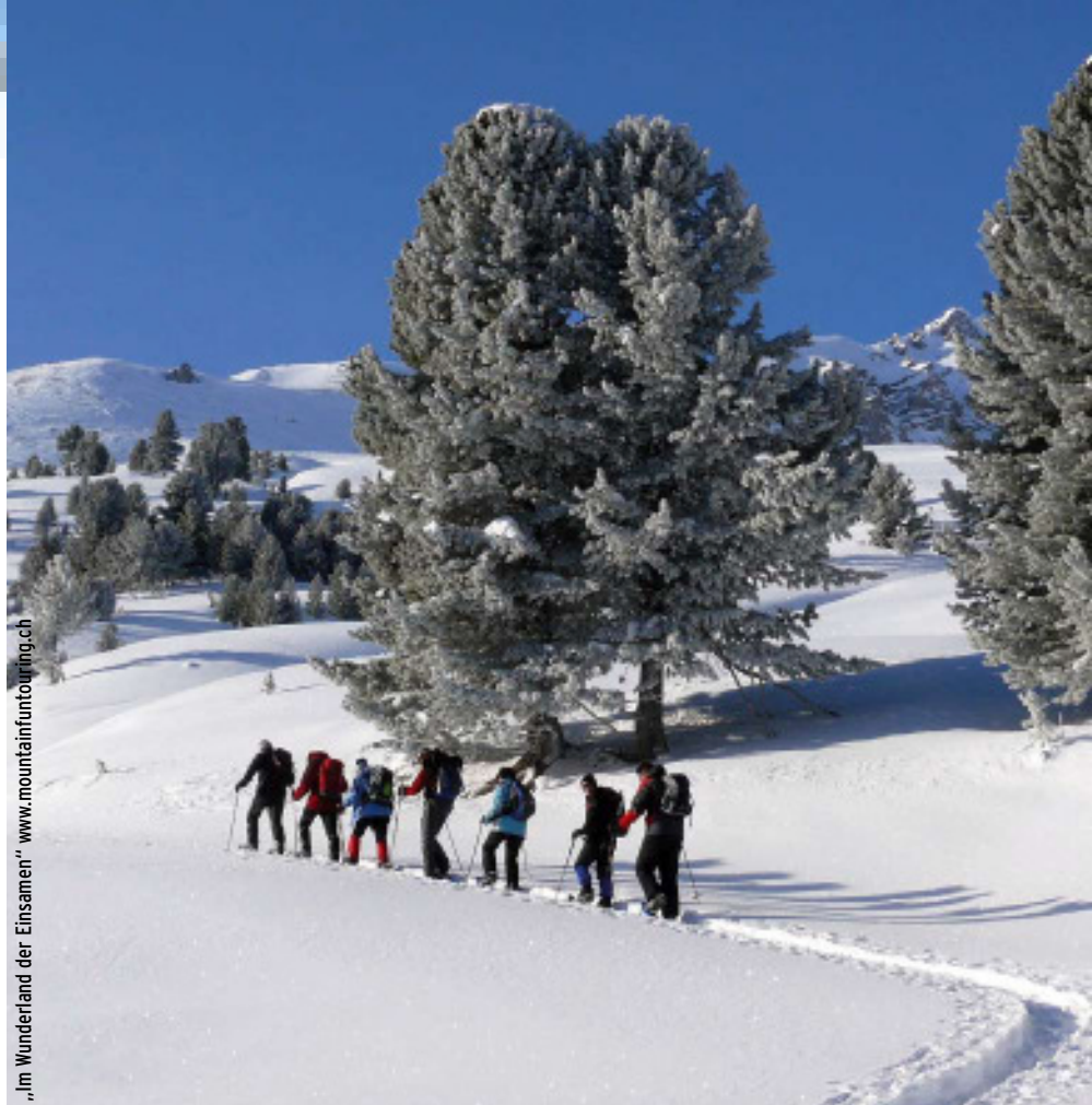
„Im Wunderland der Einsamen“ www.mountainfuntouring.ch

A: Do. 28.01.2010, VB: Di. 09.02.2010 18:00