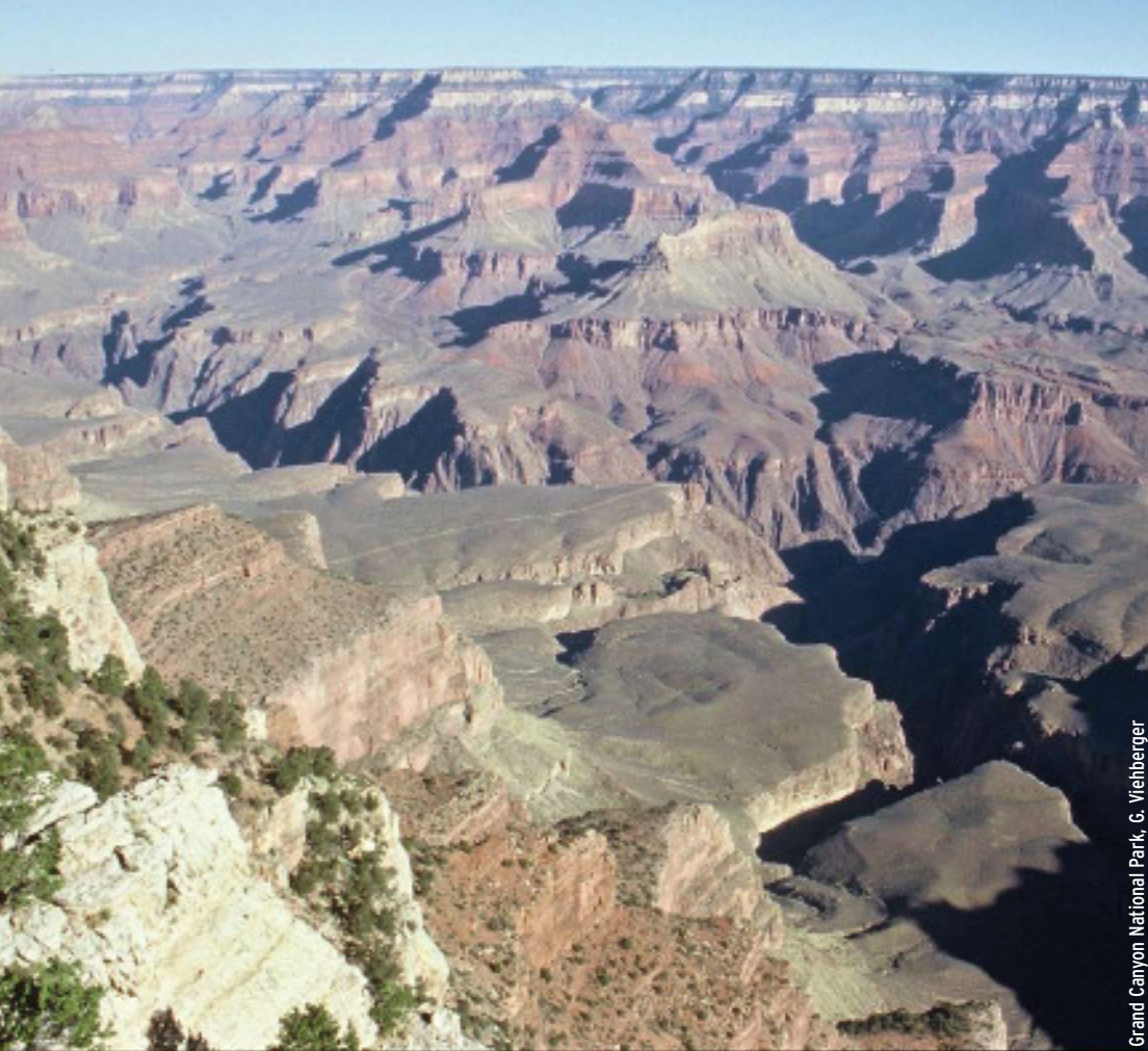
Grand Canyon National Park, G. Viehberger