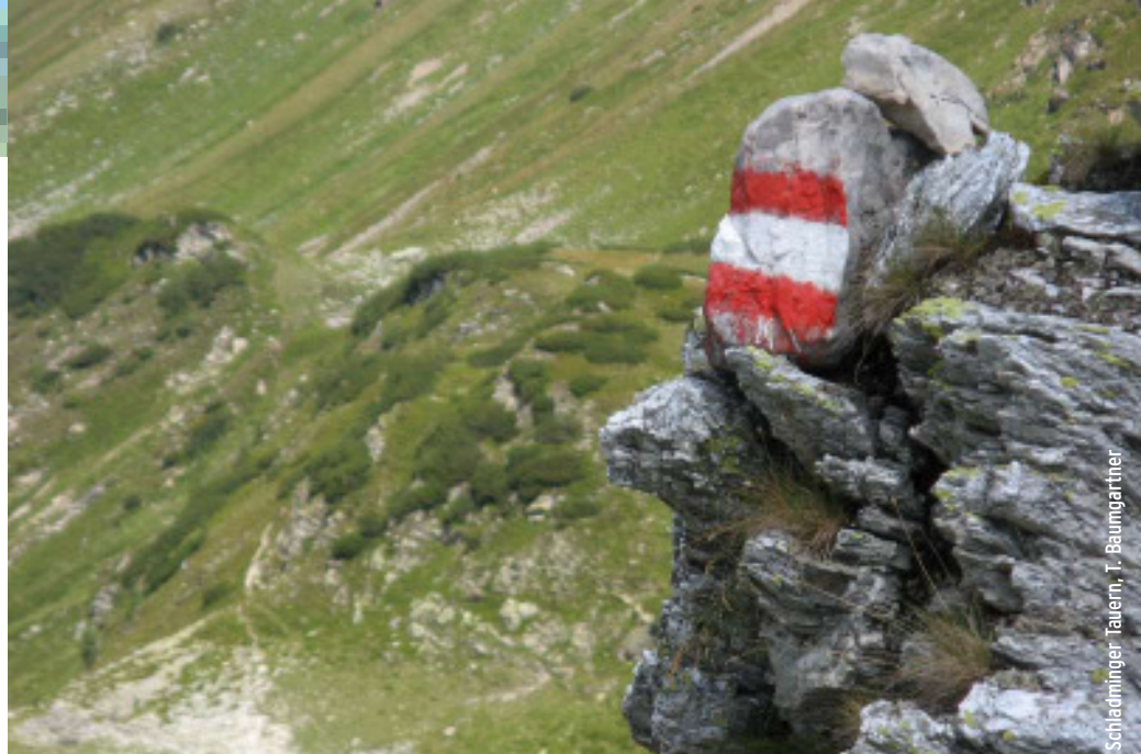
Schladminger Tauern, T. Baumgartner

A: Fr. 03.09.2010, VB: Di. 07.09.2010 18:00